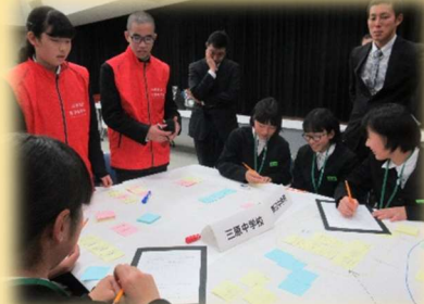
舞子高校と連携した防災教育 （中学校）