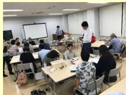
まちづくりカフェ