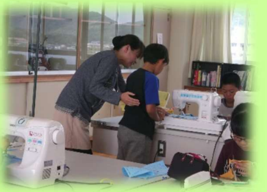
学校支援地域ボランティア