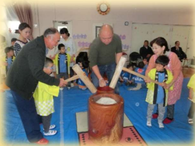
もちつき大会（幼稚園）