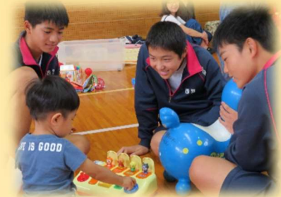
子育て体験学習 （中学校）