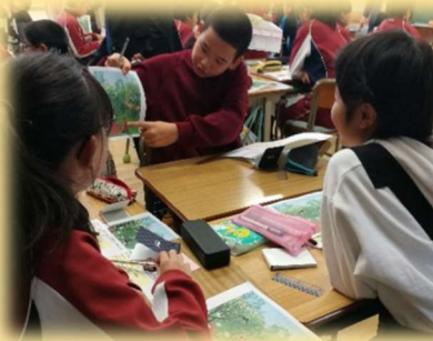
主体的・対話的で深い学び（小学校）