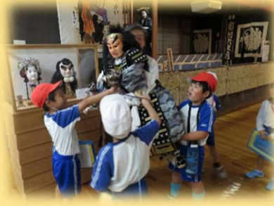
ふるさと学習（小学校）