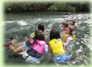
わんぱく塾 四万十川源流体験