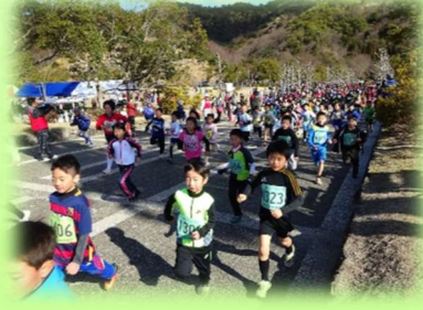
ランニングフェスティバル