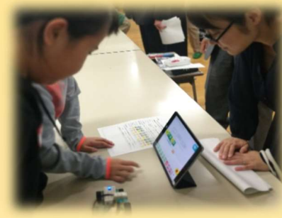
プログラミング教育（小学校）