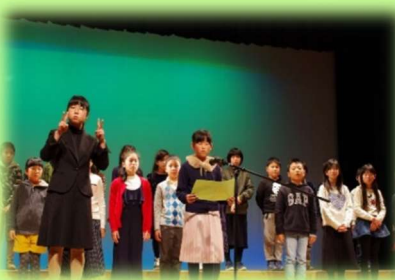
人権フェスティバル