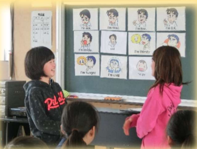
外国語活動（小学校）