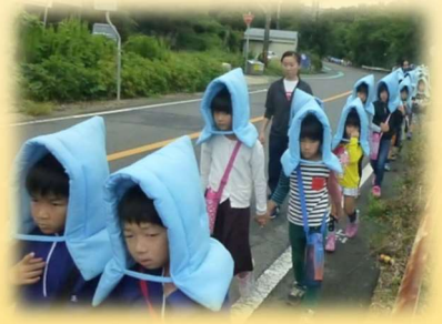
合同避難訓練（こども園・小学校）