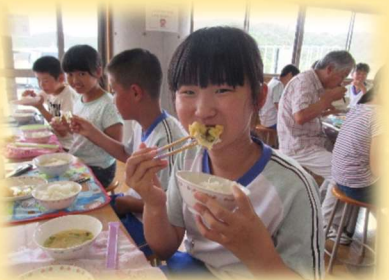
学校給食地場食材利用拡大推進事業 （幼稚園・小学校・中学校）