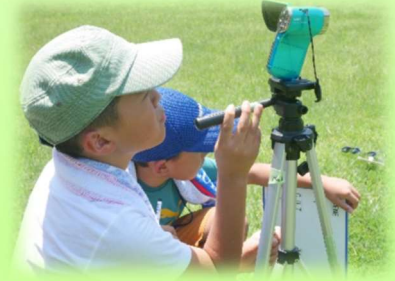
アジア国際子ども映画祭