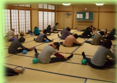
体が楽になる健康体操