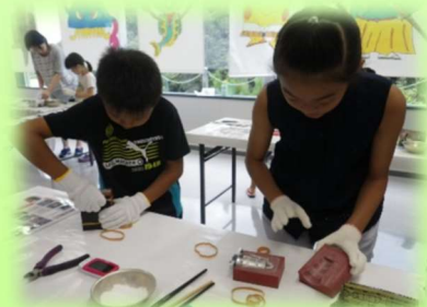
松帆銅鐸鑄造体験