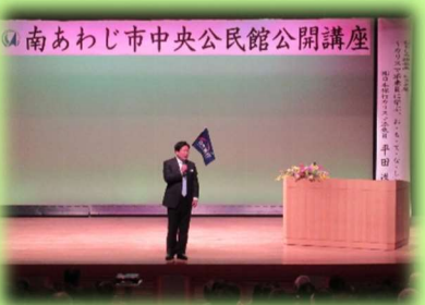
中央公民館公開講座